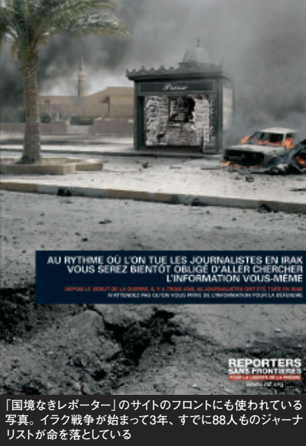
「国境なきレポーター」のサイトのフロントにも使われている写真。イラク戦争が始まって3年、すでに88人ものジャーナリストが命を落としている

しかし、ここ数年新しい現象によって活動内容が広がった。レポーターの誘拐だ。グローバル化する