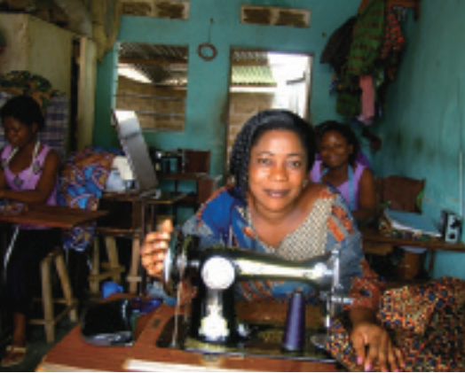
女性が元気に働くミシン工房。手前の女性が経営者。