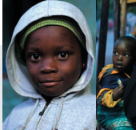
編み物屋ファティマの娘。