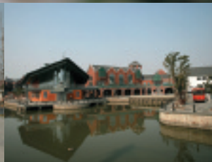
川にかかる橋の上からの眺め