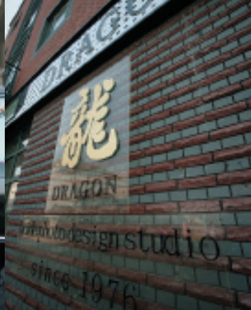
教会の周りには、このような結婚撮影ビジネスの会社が複数店舗を構える

空気がきれいで緑も多い松江の風土と、落ち着いた雰囲気の特ムズタウンならではの産業です