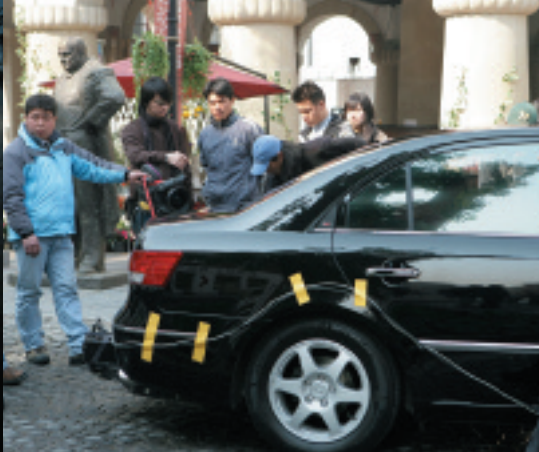
商業地区はコマースの撮影にも使われている