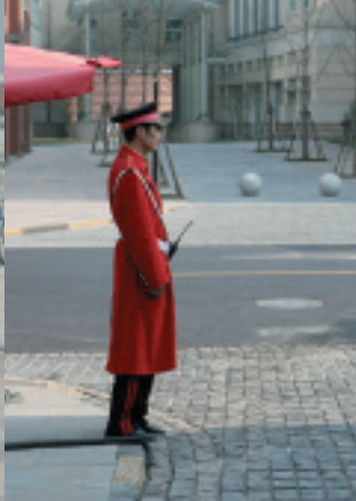
いたるところに、この服装の守衛がいる