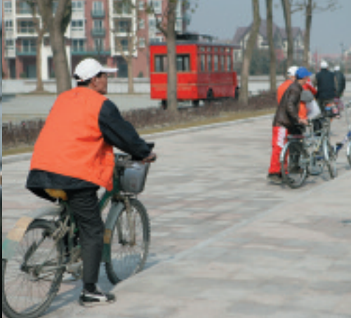
テムズタウン内をサイクリングに来た年配の人々