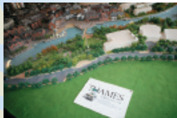
精巧に作られた模型でテムズタウンの全体が見渡せる