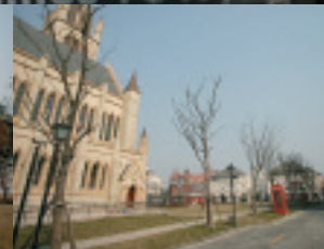
教会の右(写真奥)が商業地区

2006年10月、上海郊外に「小さなイギリス」が現れた。その名も「テムズタウン(泰晤士小鎮)」。イギリスのさまざまな時代の建築物をそのまま中国で作りあげ、ひとつの高級住宅街にしてしまったのだ。格差が限りなく広がる中国で、最も経済的に成功をおさめた最富裕層に人気を集めるこの異次元空間を歩いてみた。そこには現代の中国のひとつの側面が、確かに映し出されている。