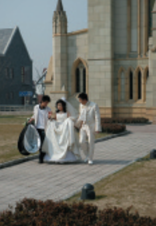
教会前での結婚写真の撮影