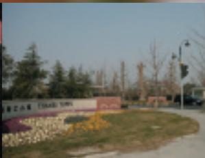
テムズタウンの入り口