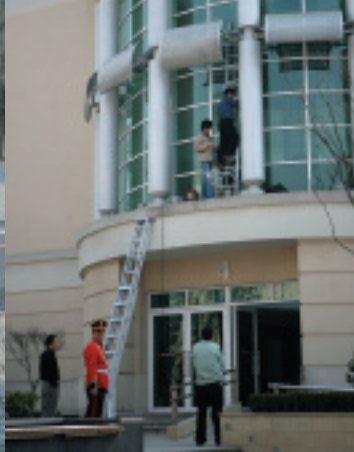
まだ工事中の建物も多い