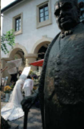
チャーチル像の後ろでも撮影