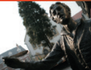
シェイクスピアの像