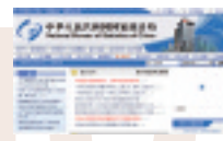
中華人民共和国国家统计局(中国語、英語) http://www.stats.gov.cn/

中国国家统计局が2007年1月25日に発表した「2006年の国内総生産(GDP)の実質成長率」は、前年比10.7%であった。政府目標の8%を上回り、伸び率は4年連続で10%を超えた。GDP総額は20兆9407元。中国経済の規模は5年で2倍近く膨らんだ。