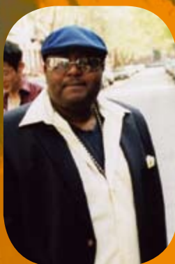
ファザーグースことウエイン・ローデンさん。

ジャマイカ出身、ブルックリン育ち。ダンスホールのDJとして音楽に携わり始める。90年代、Rankin Donという名前のラッパーとしてデビュー。「Baddest DJ」などのヒット曲がある。2000年、子供向け音楽家、ダン・ザーンズのCDにファザーグース (Father Goose) として参加。以来、ザーンズさんのツアーやテレビ番組に参加し、子供達の人気者となる。昨年、初のソロアルバム、「IT'S A BAM BAM DIDDLY!」を発表。サテライトラジオで1位、ビルボード・レゲエ部門で7位。「両親が推薦する子供の歌」にも選ばれた。